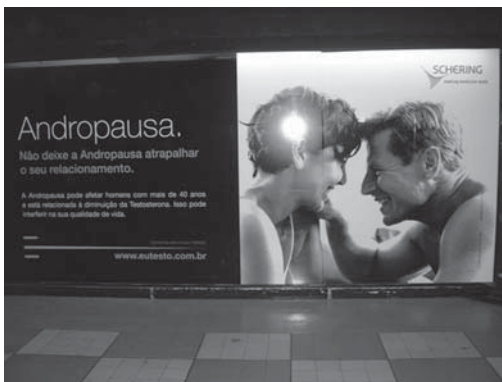
Figura 2. Outdoor exhibido en el aeropuerto de Congonhas, São Paulo, Brasil.

5) ¿Por qué no todos? a) La definición patrón de la depresión es comportamental, afectiva y discursiva, no química, pues es difícil verificar el