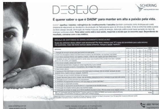
Figura 3. Cuestionario inserto en una revista de gran empresa aérea brasileña.