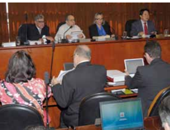
Plenário referenda apoio aos CRFs