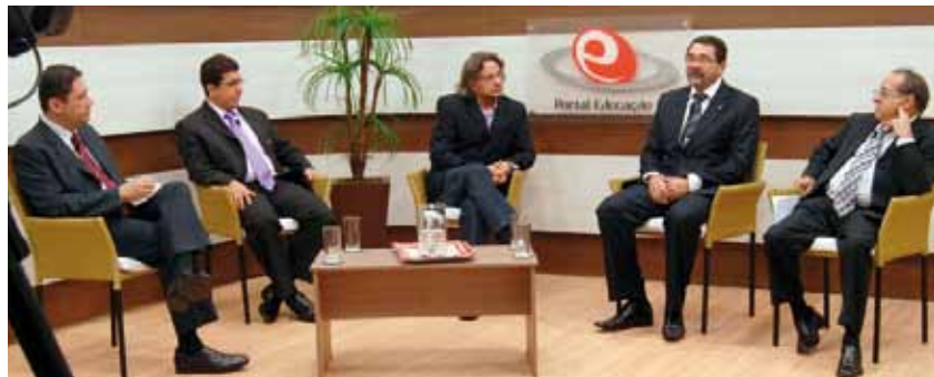
Debate durante o "Simpósio Virtual"